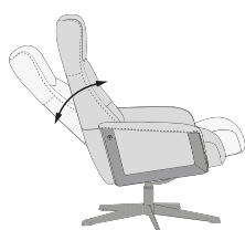
MECANISMO DE INCLINACIÓN SIN ESFUERZO