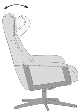
SUJECIÓN MEDIANTE FRICCIÓN DE LA CABEZA Y LA NUCA