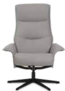
Giro a 360°

Consulte la política de garantía para más detalle.