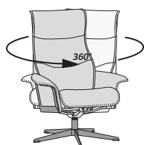
GIRO DE 360°